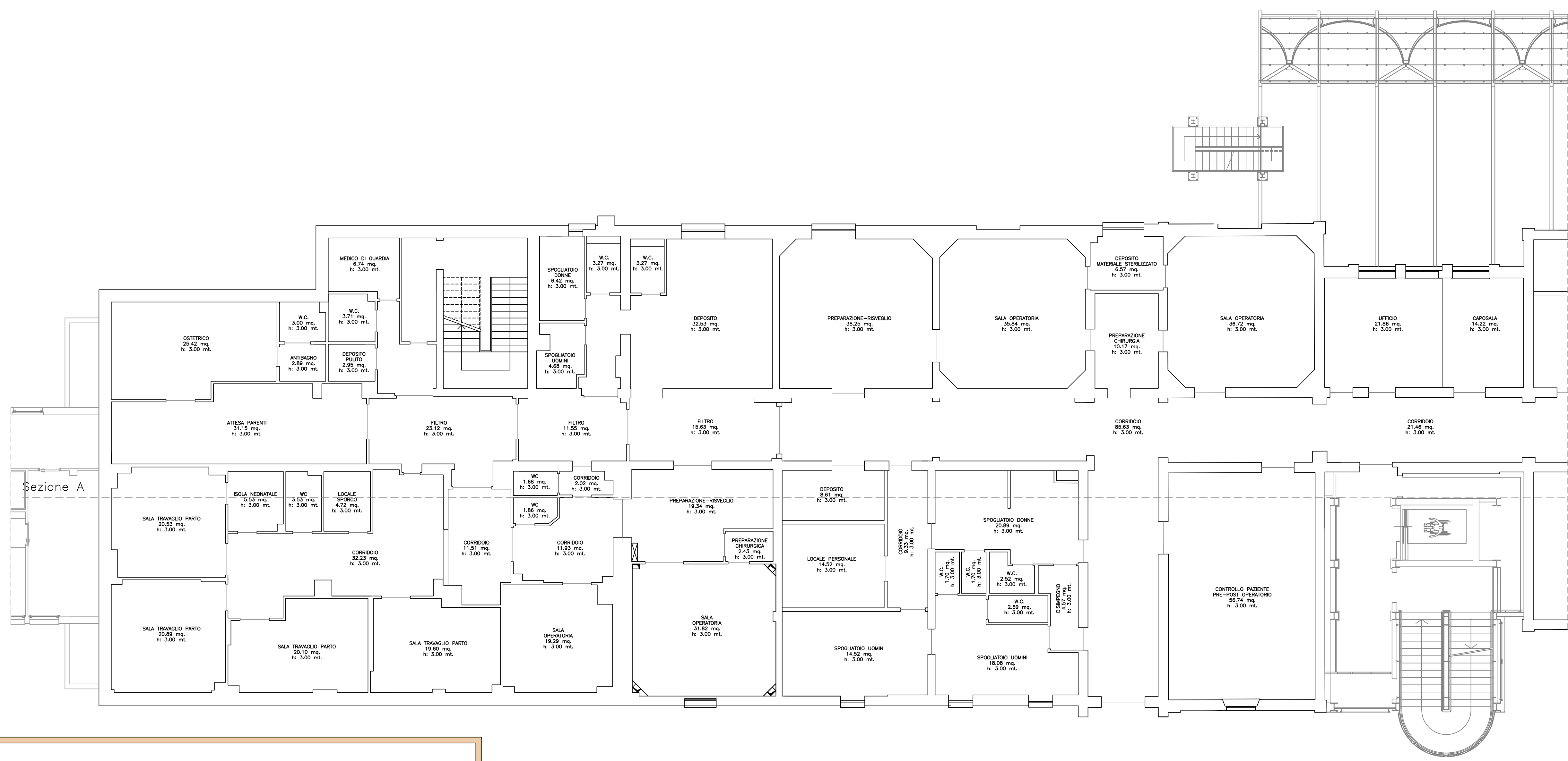
PIANTA PIANO PRIMO – scala 1:100