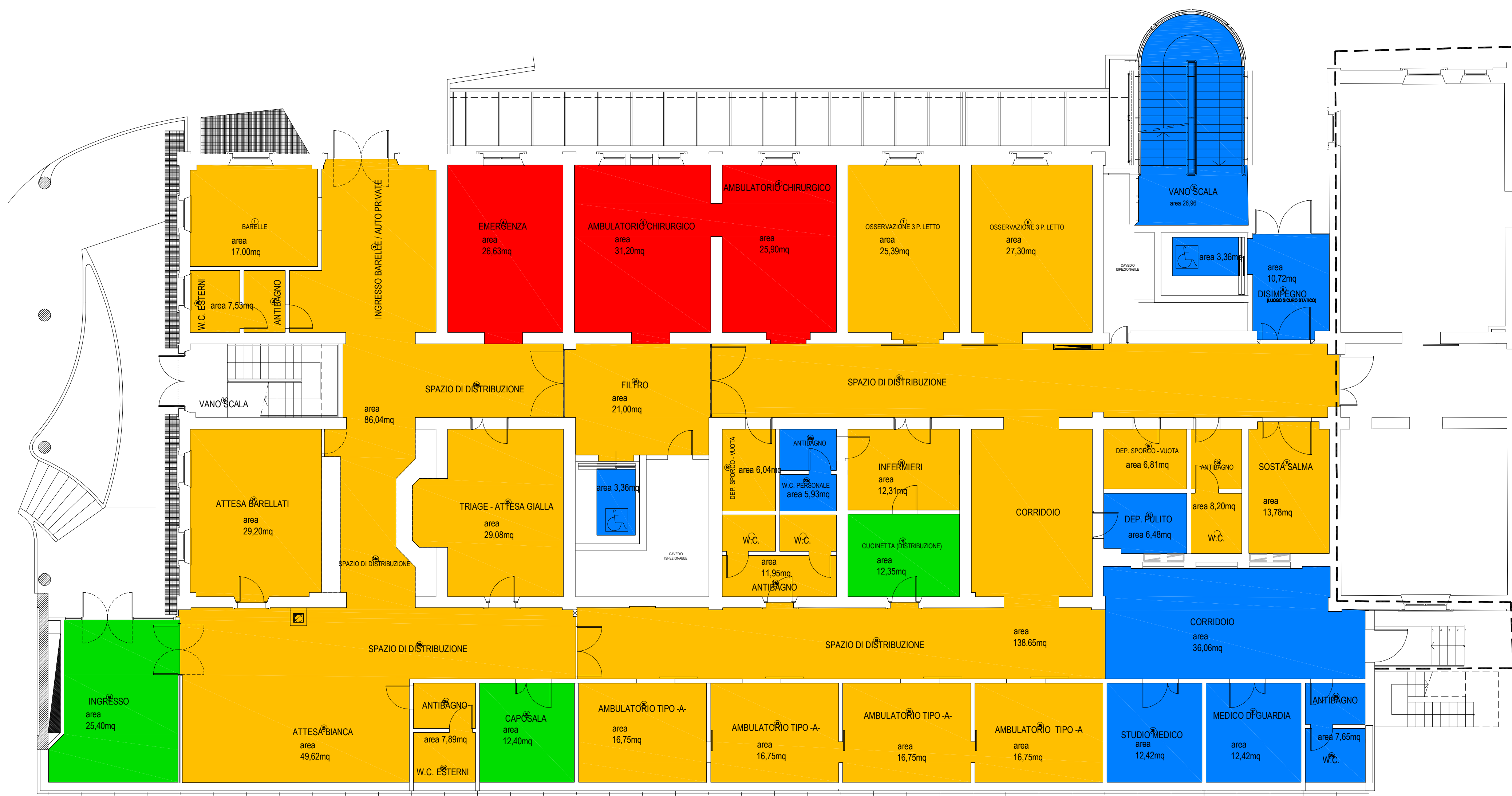
PADIGLIONE "D" - PIANO TERRA